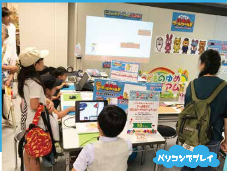
パソコンでプレイ

また「バーチャルゲームワールド」など他の作品との併設が可能です! 体験ブースと制作ブースでスペースも華やかに!