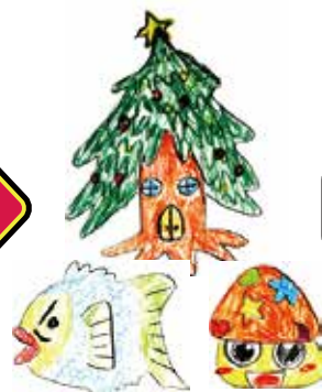
子ども達その場で描いたイラスト