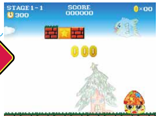
自分のイラストがゲームのアイテムや背景として登場☆