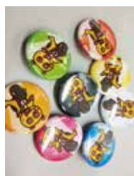
オリジナルコラボ景品も制作可能

プレイした後に点数が出て、その点数がランキング管理(トップ5まで)されます。例えば、ランキング入りした方や、1万点以上得点を取った人には景品をプレゼントする事も可能です。プレゼントは、アキラボーイのグッズを提供しています。さらにはそのイベントにあわせて、そのイベントに合わせた景品にする事も可能です。さらにはオリジナルコラボグッズの制作も可能です。