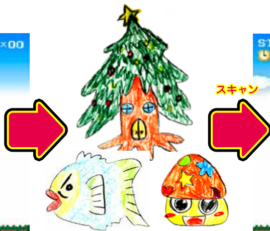
子ども達がその場で描いたイラスト