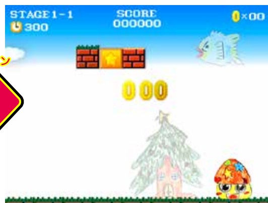
自分のイラストがゲームのアイテムや背景として登場☆